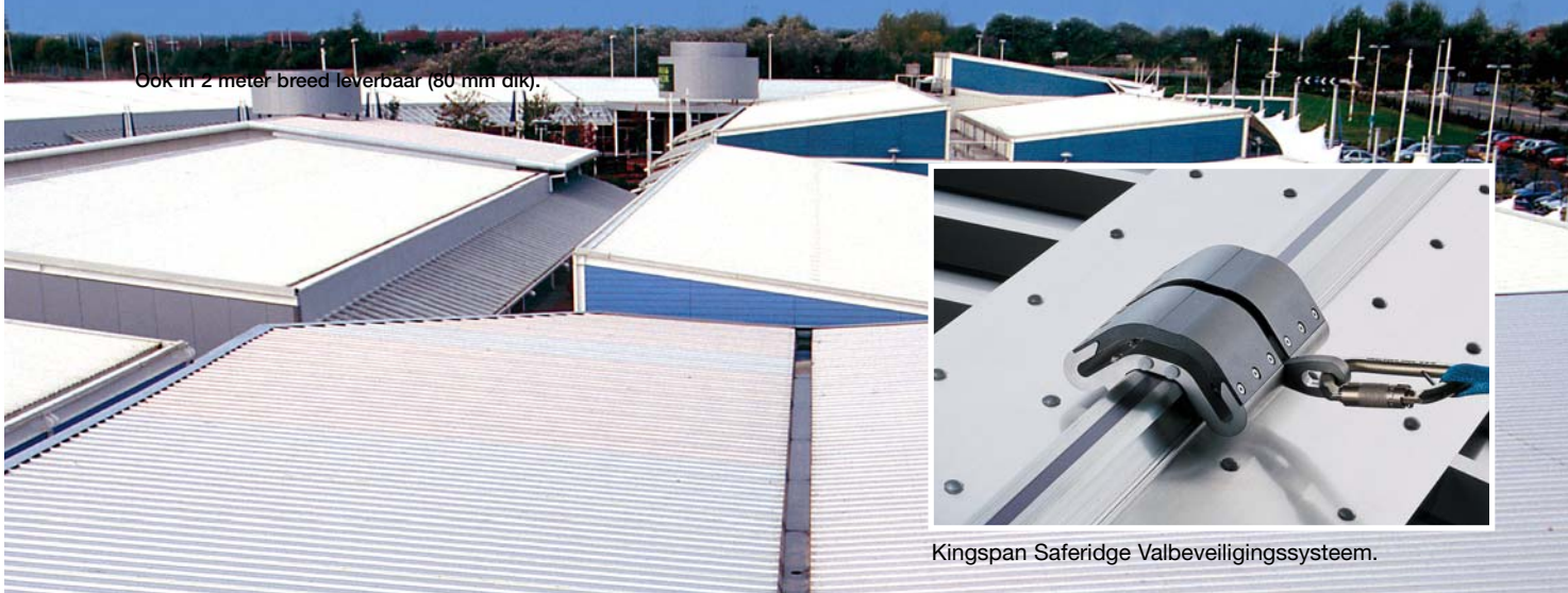
Kingspan Saferidge Valbeveiligingssysteem.

Ook in 2 meter breed leverbaar (80 mm dik).